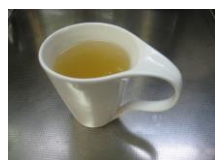
ほっとジンジャー